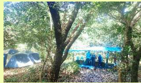
夜はランタンのあかりで過ごします

8/11 20:30竹芝棧橋集合 23:00出港 8/12 5:00大島着 仮眠 キャンプ村づくり 8/13 スノーケリング入門 8/14~16 大島の色々な所にでかけます 8/17 スケジュールをみんなできめよう 8/18 テント撤収 13:20大島発 17:40竹芝棧橋到着